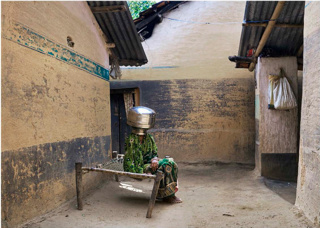
© für alle Abb.: Anja Bohnhof, aus „The Last Drop“, 2019. Courtesy Galerie m, Bochum